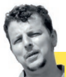
Par Thierry Germain

L'élection de Donald Trump a changé la face du monde, et cela ne s'est pas produit à n'importe quel moment. Comment ne pas être saisi par le choc frontal que représentent, pour le devenir de nos sociétés, les agissements sans retenue d'un président américain délibérément sceptique ou hostile devant la plupart des urgences que la communauté internationale avait inscrites à son agenda depuis plusieurs années, des adaptations climatiques aux régulations économiques, en passant par la réduction des inégalités les plus criantes. Tête de gondole d'une vague conservatrice et nationaliste qui ne cesse de monter en puissance, emportant sur son passage bien des digues qui semblaient il y a peu encore immuables, le trumpisme est l'œil d'un large cyclone, générateur de multiples tempêtes. Face à ces tempêtes, en France et en Europe, de quelles boussoles disposons-nous ? L'une des plus essentielles, ce sont les modèles, et la France n'en est pas avare. Cela comprend les modèles hérités dont nous sommes garants du bon devenir et