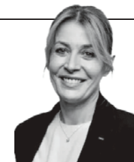
Par Nathalie Koenders