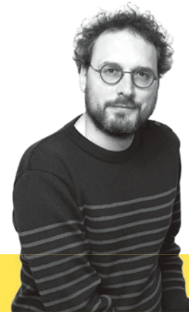
Par Laurent Jeanneau

Retrouvez le programme complet des Journées sur www.journeeseconomieautrement.fr