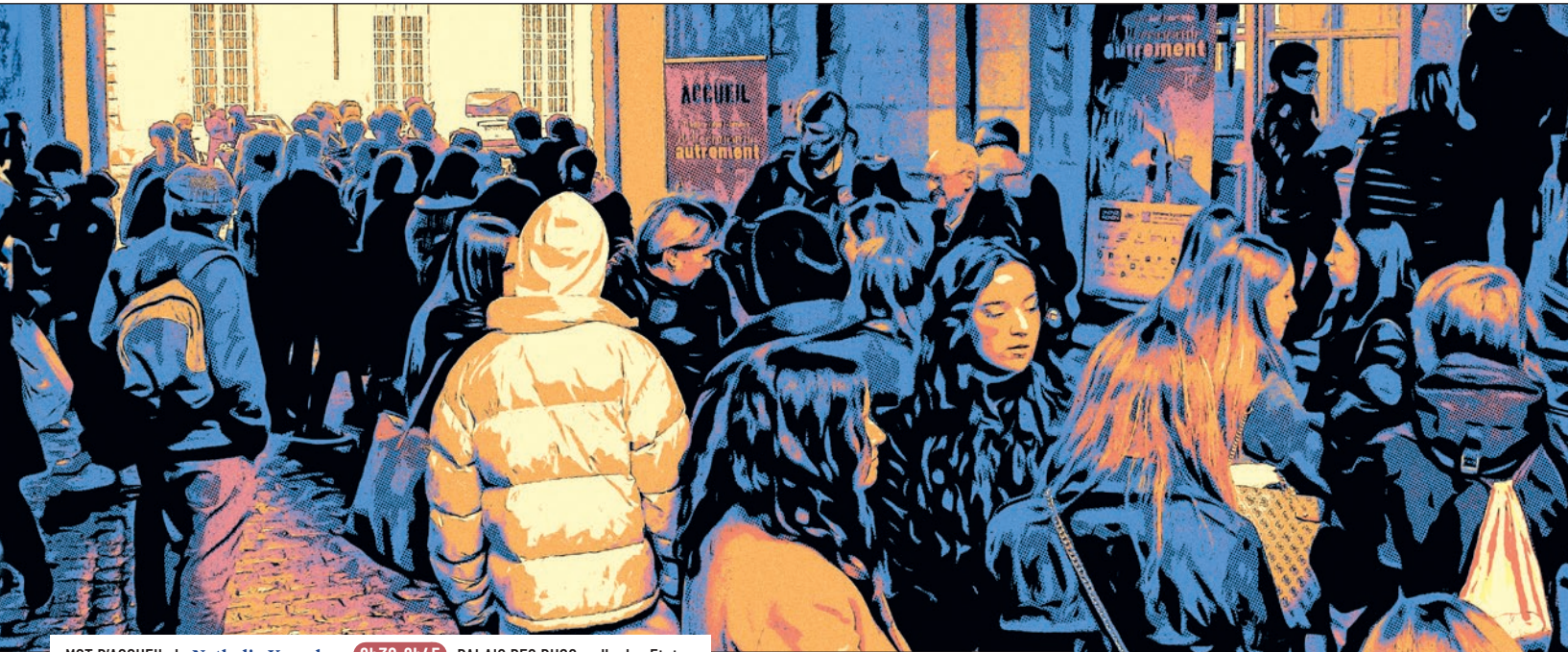
MOT D'ACCUEIL de Nathalie Koenders 9h30-9h45 PALAIS DES DUCS, salle des Etats