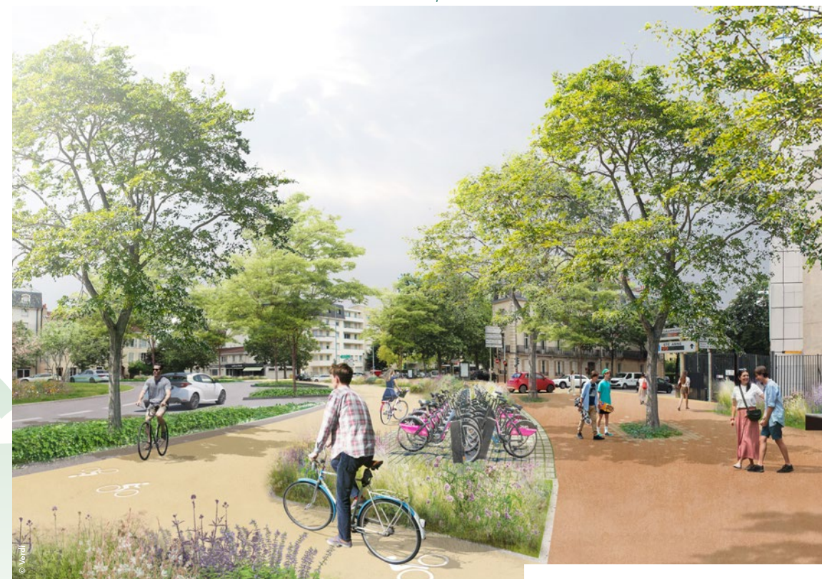
Avril 2024 • Direction de la communication ville de Dijon/Dijon métropole • Ne pas jeter sur la voie publique • Imprimé sur du papier PEFC

*Les dates des travaux sont données à titre indicatif. Elles pourront évoluer en fonction des aléas du chantier.