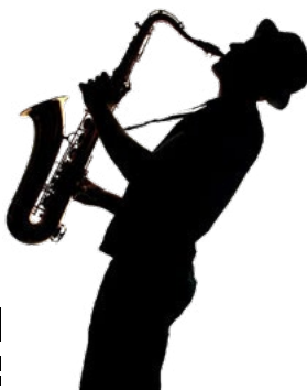
Brochure n° 1