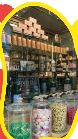
Epicierie Fagart

2-3 ans (un enfant accompagné d'un parent)