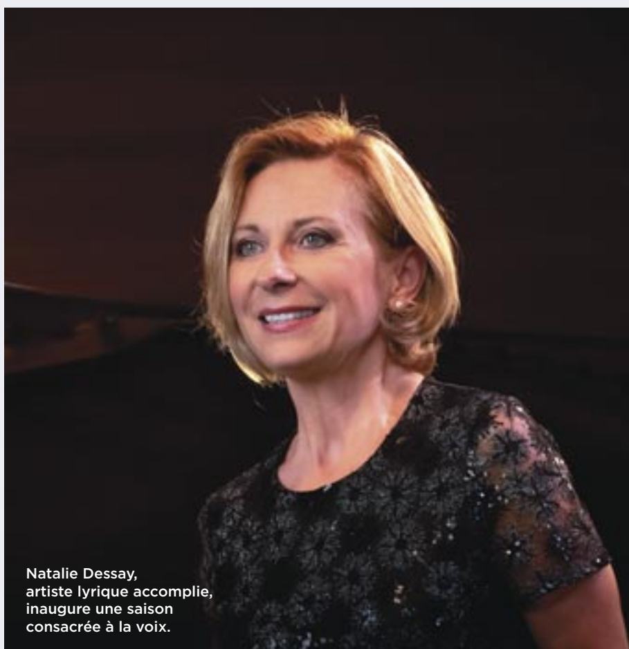
Natalie Dessay, artiste lyrique accomplie, inaugure une saison consacrée à la voix.