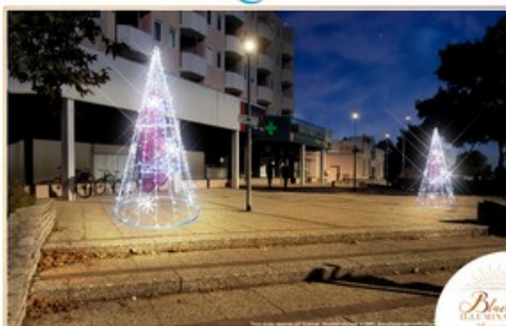
Ville de Dijon Boulevard Mansart

Pour la première fois cette année, un budget a été alloué aux quartiers qui ne bénéficient pas d'illuminations pour la période de Noël. Suite à deux propositions des services techniques (rue Angélique Ducoudray ou boulevard Mansart), les membres de la commission de quartier se sont positionnés en faveur du boulevard Mansart.