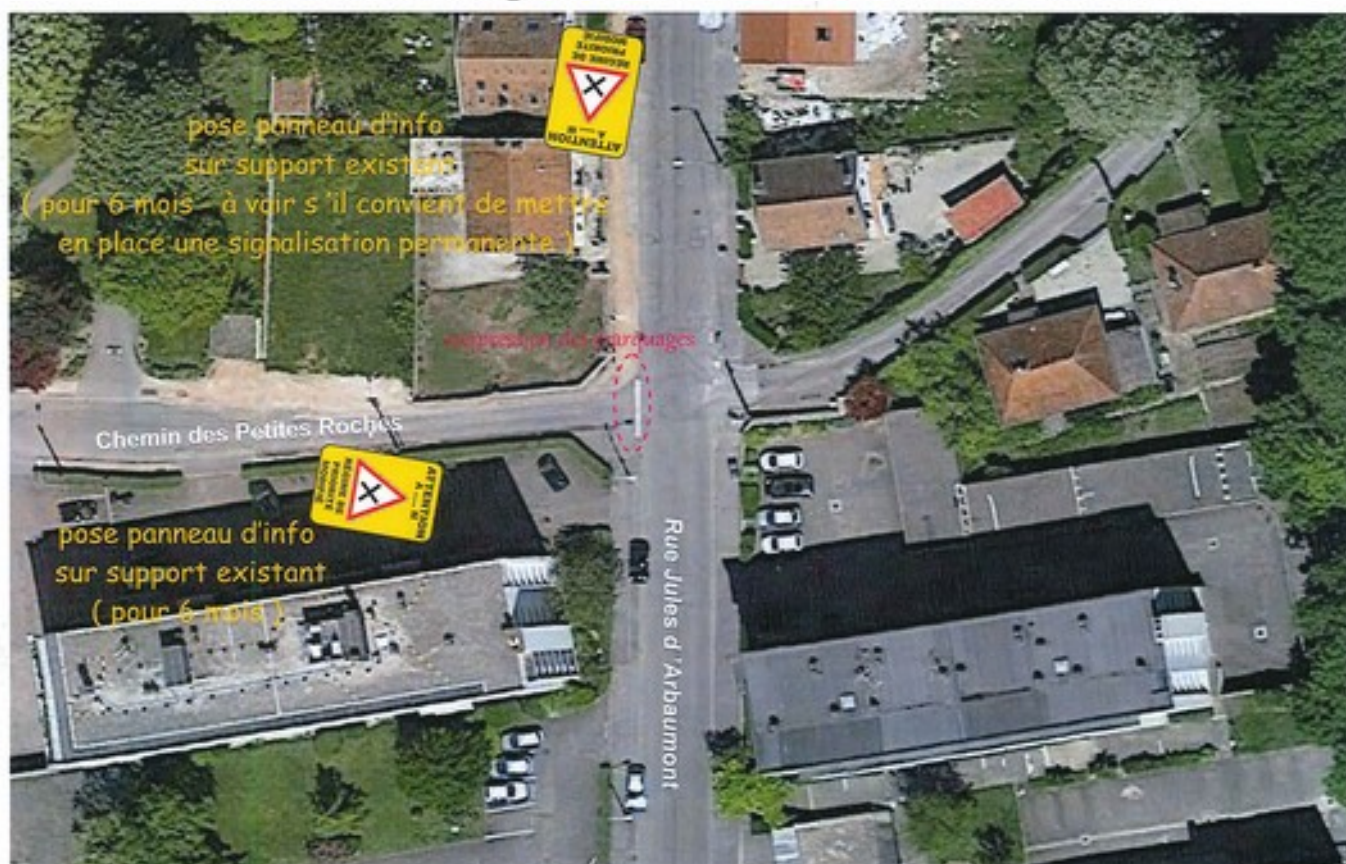
Modification du régime de priorité à l'intersection formée par la rue Jules d'Arbaumont et le chemin des Petites Roches