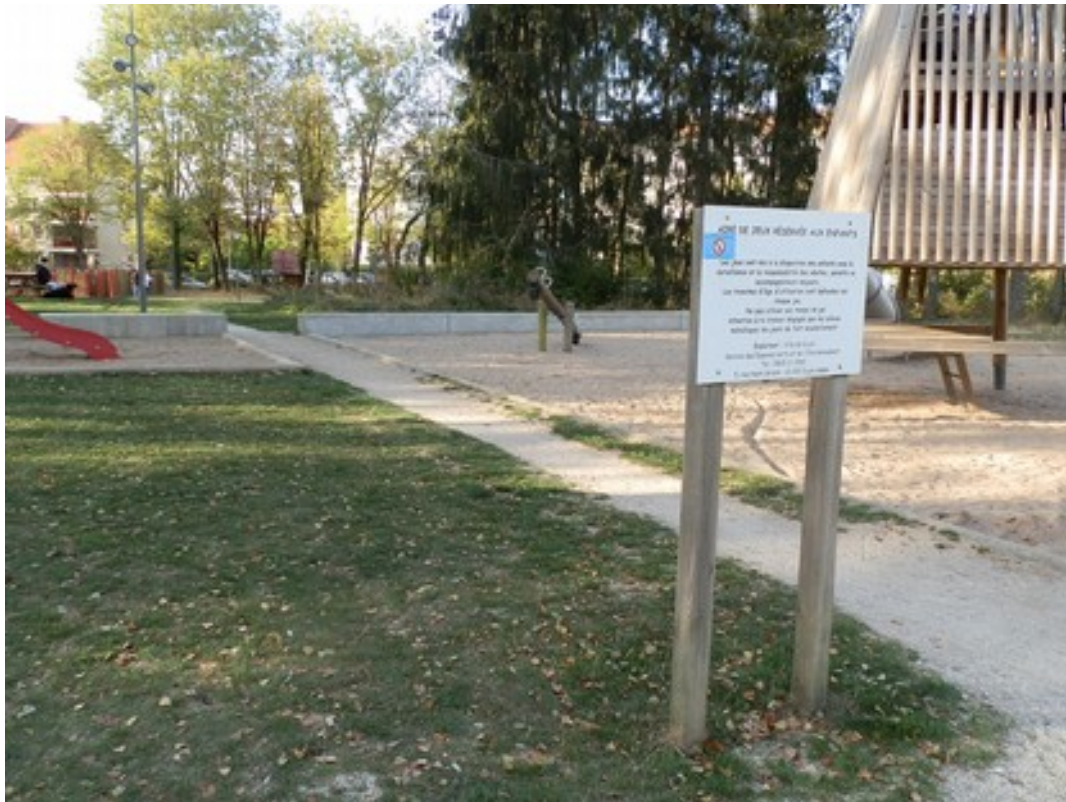
Photo du site retenu pour l'implantation de la table de ping-pong : (eu égard au budget alloué à ce projet, une seule table sera installée)

L'ensemble des travaux débutera dès le début de l'année 2019.