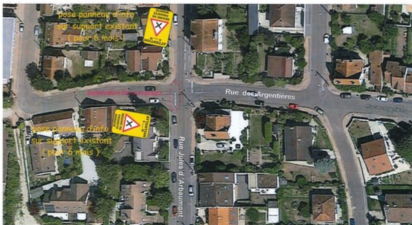
Modification du régime de priorité à l'intersection formée par les rues des Argentières et Jules d'Arbaumont